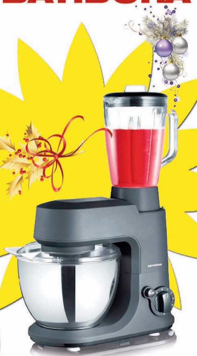
Amasadora-Batidora Severin KM3890

Características: Capacidad del cuenco: 4L / Potencia: 500W Tipo de control: Giratorio / Batidor: S Función de impulso: Si / Base antideslizante: Si Número de velocidades: 6 / Varillas batidoras: Si Color del producto: Negro / Material del cuenco: Acero inoxidable